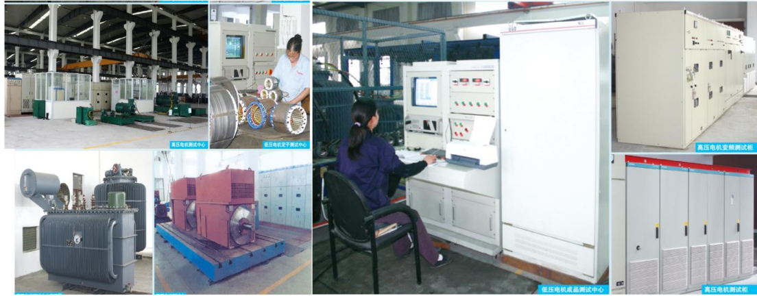
图 2 公司先进检测设备