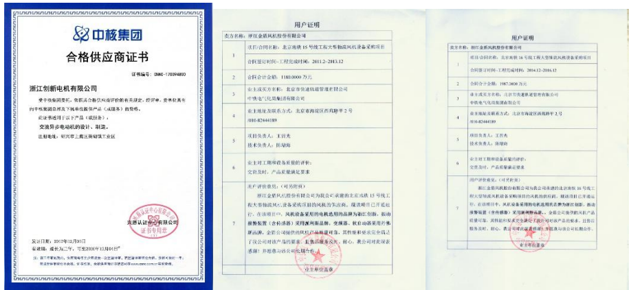
图 3 客户认可示例